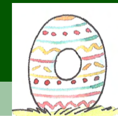
*Das doppelte Osterei

Energy Resource Coaching Empathisch • Lösungsorientiert • Individuell